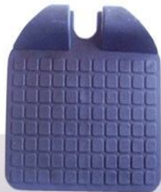
Apoyador de pies aluminio y plástico