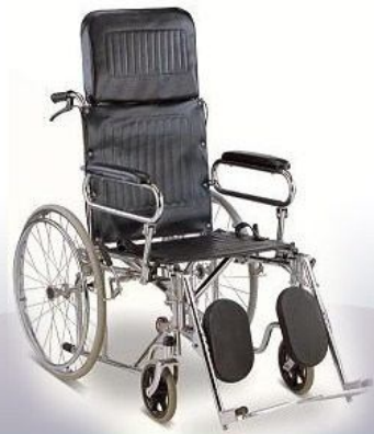
Silla de ruedas reclinable y levanta pies