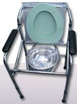
Silla sanitario plegable de fierro cromado Muletas