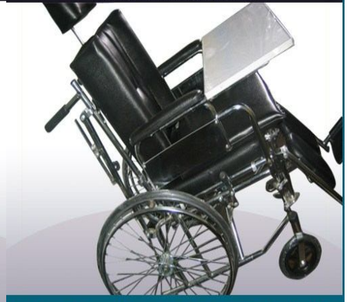
Silla de rueda desmontable brazos y pies, sanitario, reclinable, levanta pies, con espaldar de espuma y soporte de cabeza, mesa