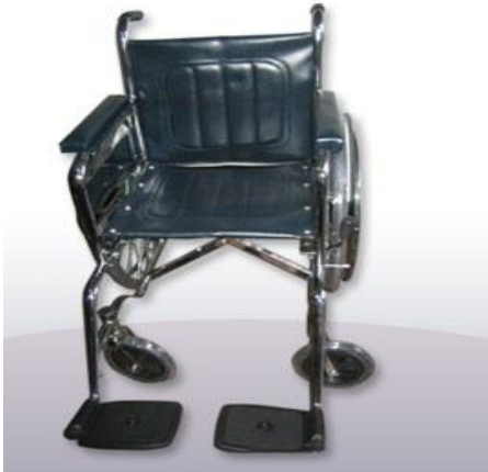
Sillas de Ruedas Plegables