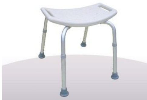
Silla de ducha aluminio sin respaldar Sillas de Water y Ducha