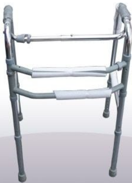
Andador importado sin rueda 2 función fijo y marca paso