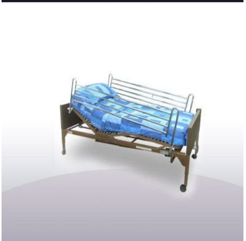
Cama clínica eléctrica con control, eleva espalda y pies