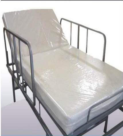
Colchón articulable de 1