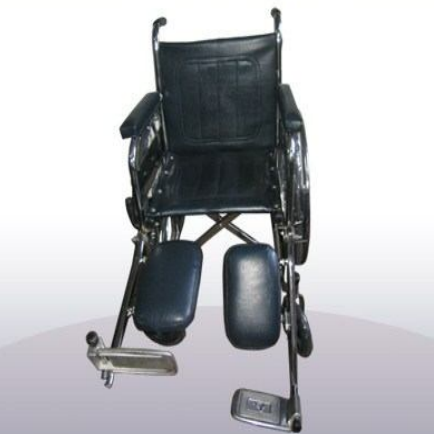
Silla de rueda traumatológica con descanso de piernas