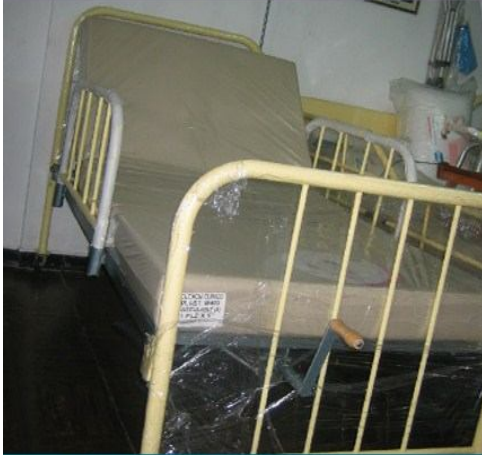
Cama clínica 1 manivela eleva espalda