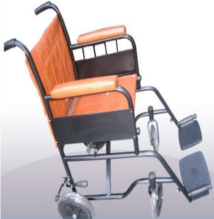
Sillas de Ruedas Importadas