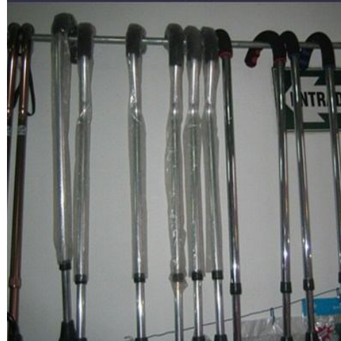
Bastones de fierro cromado y aluminio pulido