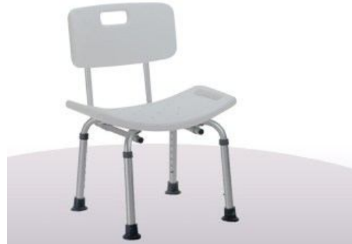
Silla de ducha aluminio con respaldar Muletas