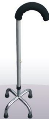
Bastón aluminio 4 patas graduable