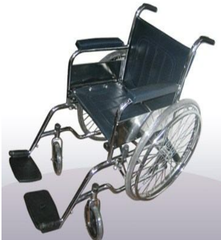
Sillas de Ruedas Importadas