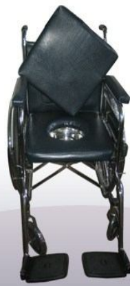
Silla de ruedas standar con sanitario