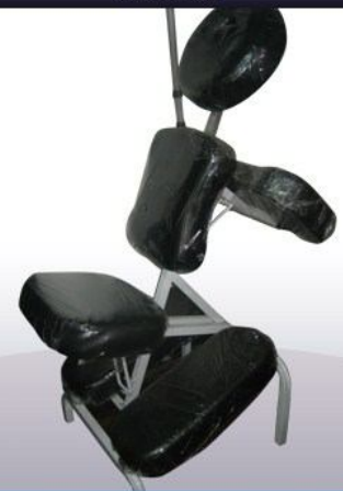
Silla de masaje y depilación 3 posiciones