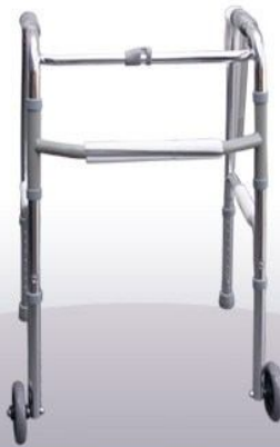
Andador con rueda importado aluminio