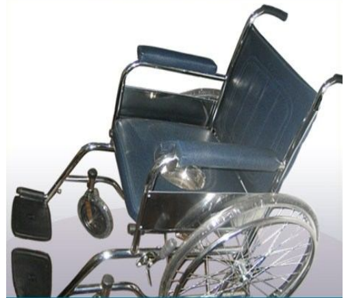
Silla standar azul con sanitario