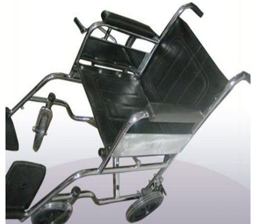
Sillas de Ruedas Importadas