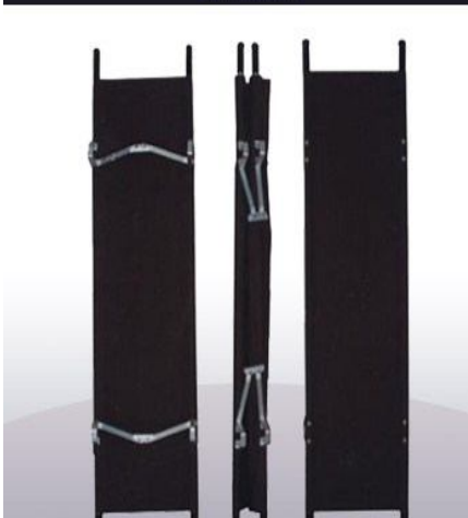
Camilla de lona