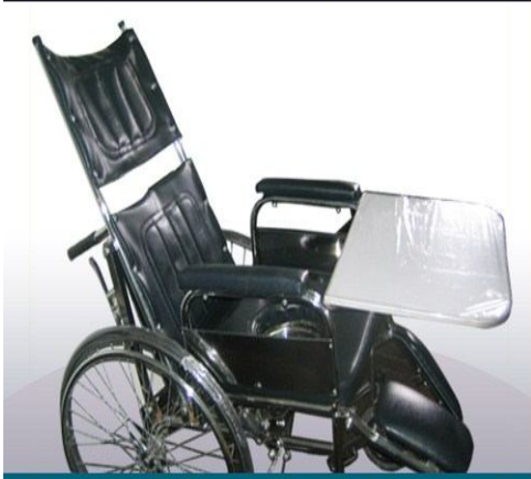
Silla de ruedas reclinable, levanta pies, con sanitario, brazos desmontables, mesa