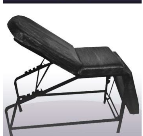
Camilla de masaje 3 partes