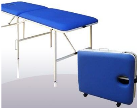
Camilla y maletín plegable de masaje con rueda