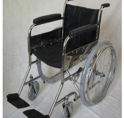
Sillas de Ruedas Importadas