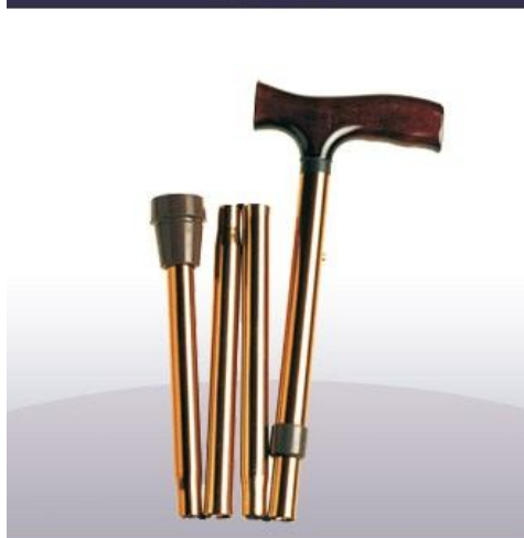
Bastón de aluminio plegable