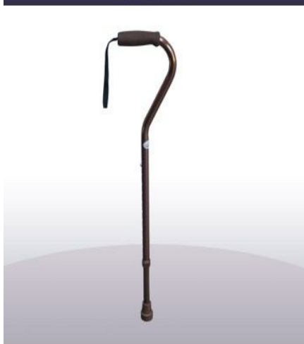
Bastón importado regaton de goma graduable