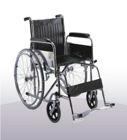
Sillas de Ruedas Importadas