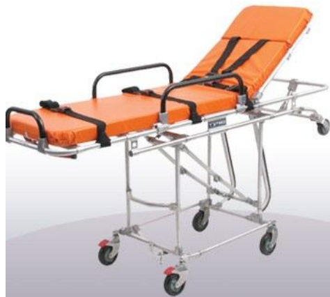
Camilla de ambulancia