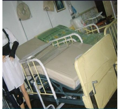
Cama clínica de 2 manivelas, barandas y porta suero