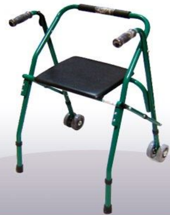
Andador con rueda y asiento