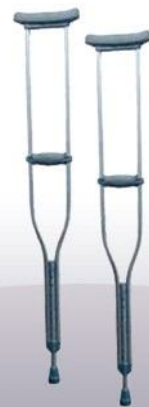
Muleta con mango de gebe importada plomo Muletas