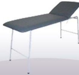
Camillas de examen cabeza móvil