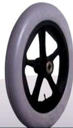
Rueda chica importada