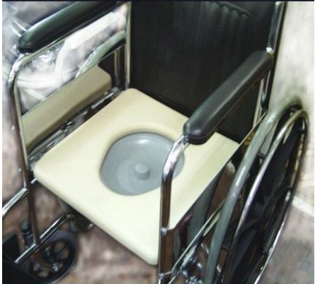
Silla de ruedas sanitaria importada