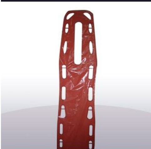
Camilla importada de emergencia rígida