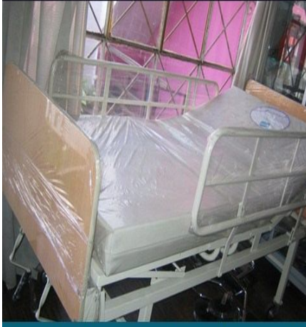
Cama clínica de 2 manivelas, eleva cabeza y pies y barandas móviles