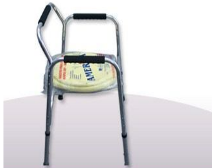
Silla sanitaria fija Sillas de Water y Ducha