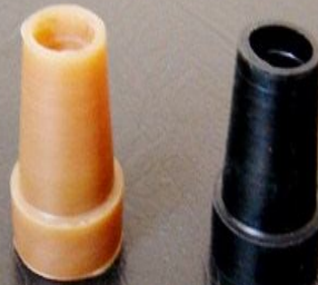
Regatones de goma