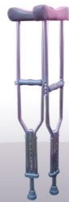
Muleta de aluminio nacional