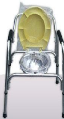
Silla water fijo aluminio pulido Muletas